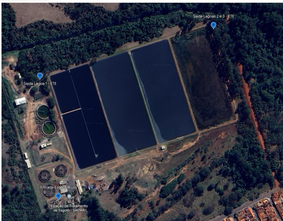
Localização dos pontos 01, 02 e 03 do Lote 01