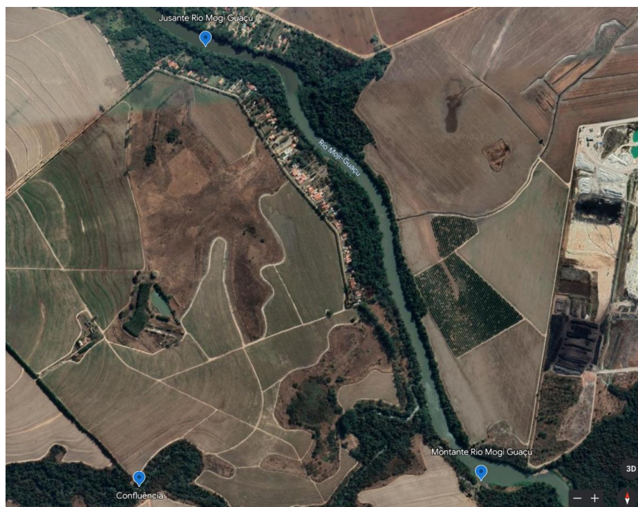
Localização dos pontos 06, 07 e 08 do Lote 02