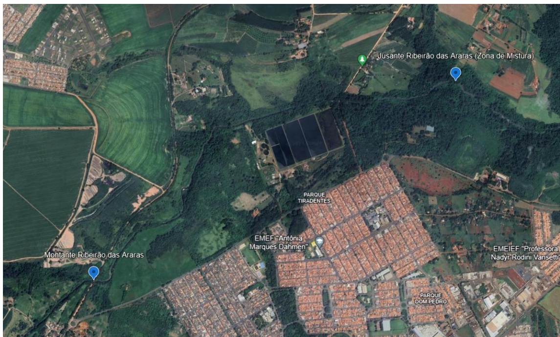
Localização dos pontos 01 e 05 do Lote 02